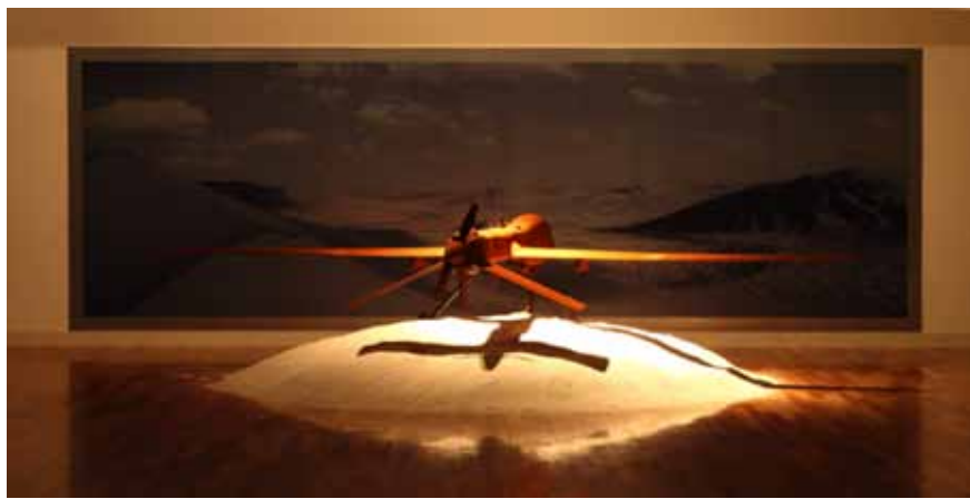
《Landmark 2012》2012 mixed material