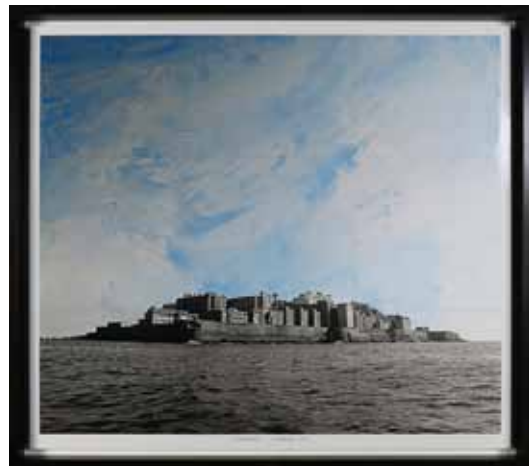
《Landscape Hashima 2001》2009 oil drawing on photograph

〒870-0835 大分市大字上野865番地 TEL:097-554-5800 FAX:097-554-5811 ホームページアドレス http://www.city.oita.oita.jp/ →総合案内「楽しむ」→大分市美術館