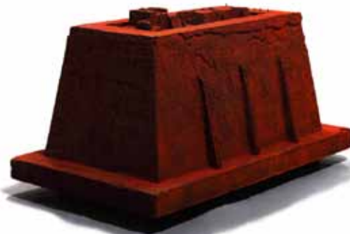
《Landscape 表相 1993-1》1993 iron